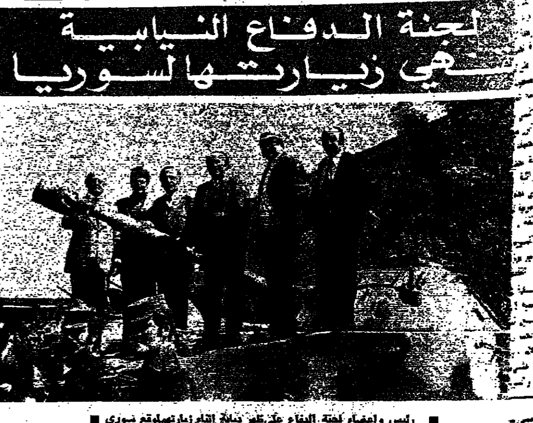
رئيس وزرا مصر محمد نوري وأعضاء لجنة الدفاع المصرية في زيارة إلى سوريا

لجنة الدفاع النيابية هي زيارتها سوريا بيروت ٢٤ آذار - أشارت مصادر مطلعة في دمشق إلى أن وفد لجنة الدفاع النيابية المصرية برئاسة وزير الدفاع محمد نوري وزير الخارجية السورية، قد وصل دمشق صباح اليوم الاثنين ٢٤ آذار ١٩٦٥. وقد استقبل الوفد بالحرارة من قبل الرئيس السوري جمال عبد الناصر ورئيس مجلس الوزراء محمد داود العبدون. والوفد الذي يضم عدداً من أعضاء اللجنة المصرية، ضم أيضاً أعضاء من قيادة القوات الجوية المصرية، ورجال القوات الجوية السورية، ووفد من القوات الجوية الليبية، إضافة إلى عدد من الصحفيين المصريين والسوريين. وقد حضر إلى مطار دمشق وزير الدفاع محمد نوري ووزير الخارجية السوري محمد داود العبدون، ورئيس مجلس الوزراء محمد داود العبدون، ورئيس مجلس الوزراء محمد داود العبدون، ورئيس مجلس الوزراء محمد داود العبدون. وقد استمر الوفد في دمشق لمدة يومين، ثم انتقل إلى حلب، وهناك استقبله وزير الدفاع السوري محمد داود العبدون، ووزير الخارجية السوري محمد داود العبدون، ورئيس مجلس الوزراء محمد داود العبدون. وقد حضر إلى مطار حلب وزير الدفاع محمد نوري ووزير الخارجية السوري محمد داود العبدون، ورئيس مجلس الوزراء محمد داود العبدون، ورئيس مجلس الوزراء محمد داود العبدون. وقد استمر الوفد في حلب لمدة يومين، ثم انتقل إلى اللاذقية، وهناك استقبله وزير الدفاع السوري محمد داود العبدون، ووزير الخارجية السوري محمد داود العبدون، ورئيس مجلس الوزراء محمد داود العبدون. وقد حضر إلى مطار اللاذقية وزير الدفاع محمد نوري ووزير الخارجية السوري محمد داود العبدون، ورئيس مجلس الوزراء محمد داود العبدون، ورئيس مجلس الوزراء محمد داود العبدون.